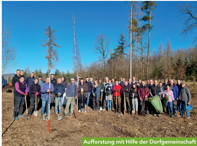
Aufforstung mit Hilfe der Dorfgemeinschaft

Ursprünglich wurde Germete als kleines Dorf im Diemeltal gegründet. Im Laufe seines über 1000-jährigen Bestehens veränderte sich nicht nur das Dorf, sondern auch die es umgebende Landschaft. Besonders deutlich wird dies in Wald und Flur. Aufgrund von erhöhtem Holzbedarf in diversen Kriegen, nach Brandkatastrophen und aktuell in Folge des Klimawandels zeigt „der Wald“ sich in einem stetig neuem Gesicht. Auch in der Landwirtschaft vollzog sich über die Jahrhunderte ein Wandel: Durch zunehmende Technisierung entstanden immer größere Äcker mit einer geringen Auswahl an Anbaufrüchten. Letztlich führte die Erschließung der Mineralwasserquellen um 1900 zu einer Art Industrialisierung des Dorfes, was sich auch bis heute im Dorfbild niederschlägt.